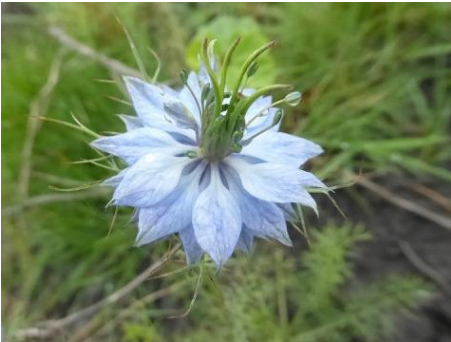
Juffertje in het groen