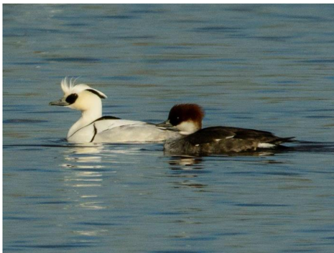
Nonnetje (links mannetje, rechts vrouwtje)