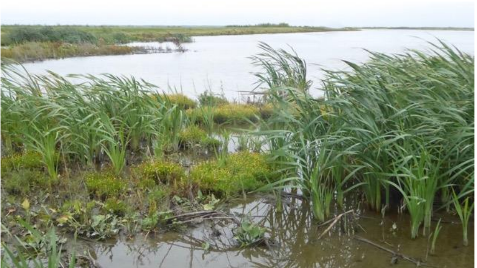
Goudknopje en riet