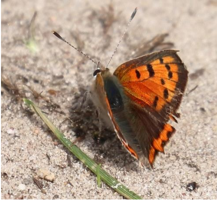
Kleine vuurvinder

In kwelzones van de slenk waar in natte tijden een beekje stroomt en nu midden in de zomer nog wat water sijpelt was een gradiënt van droge naar natte heidevegetatie te bewonderen met reeds bloeiende Struikheide, Dopheide, de zeldzame Grondster en Beenbreek, die nog deels getooid was met helder gele bloemen en deels al behoorlijk wat saffraankleurig zaad droeg.