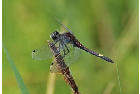
Gevlekte witsnuitlibel