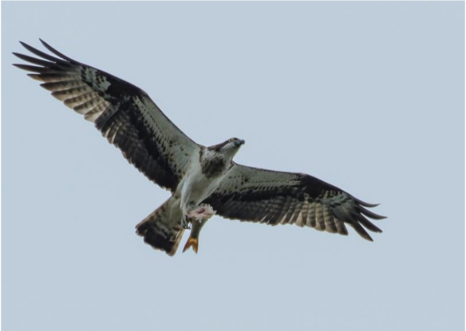
Visarend met prooi

dan maar verder en rijden een weg in die verboden is voor auto's m.u.v. 'bestemmingsverkeer', dat is gewaagd. De witkopsarend laat zich ook niet vinden, maar wel zien we, op flinke afstand een visarend met prooi. Mooi is te zien hoe de arend de prooi in zijn kauwen houdt met de kop naar voren zodat de vis stabiel blijft in de vlucht. Sinds 2016 broeden er visarenden in de Biesbosch. In het relatief ondiepe water kunnen ze volop voedsel vinden.