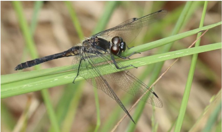
Zwarte heidelibel

De bestemming was het Deelensche Veld, een weinig bezochte uithoek van de Hoge Veluwe. Alleen het Deeler Wasch, een fraai ven met een steiger nabij een fietspad, wordt druk bezocht. Het gebied daarachter met rulle zandpaden kenmerkt zich door een hoge biodiversiteit. Het terrein is vrij hoog gelegen binnen de Hoge Veluwe. Het grondwater zit er vele meters diep maar vanwege een dunne waterkerende laag van ijzerverbindingen is erboven een schijn-grondwaterspiegel met vennen. In zeer natte perioden stroomt er zelfs een bescheiden heidebeekje door een oud smeltwatergeul uit de ijstijd welk enkele heidevennen verbindt en stroomafwaarts in stuifzand verdwijnt.