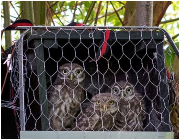
jonge steenuilen

NB: Karel Schot was een onderwijzer in R'dam die op een gegeven moment een gewonde vogel opnam in zijn klas en die verzorgde. Al spoedig kwamen de kinderen met meer gewonde dieren en zo groeide dit uit tot een professionele opvang voor vogels ( www.vogelklas.nl ).