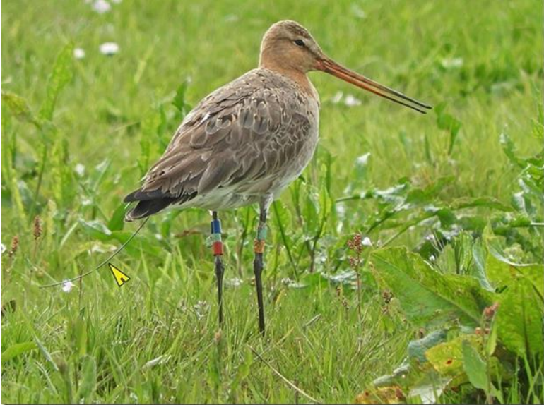
Grutto 'Leziria', de gele pijl wijst naar de zender

Op 26 april heeft Menno Kuiper uit Gouda tijdens het tellen van jonge kieviten en grutto's vanaf de Winterdijk in de Polder Bloemendaal een interessante grutto met 4 jongen gezien. Het dier viel in eerste instantie op door 5 kleurringen aan de poten. Daarna zag Menno echter een antenne van een zender aan de achterkant van de grutto uitsteken.