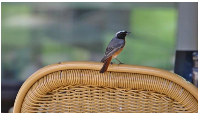
Gekraagde roodstaart

De Weerribben blijkt een stiltegebied bij uitstek, dus zonder verstoring door vliegtuiglawaai, motorbootjes of ander snelverkeer, maar wel met vogelzang! Zo liet de wielewaal liet zich alle dagen horen, soms dichtbij, dan weer wat verder weg, zowel in het Woldlakebos waar we op meerdere dagen gewandeld hebben, als tijdens de vaartocht op woensdag. Sloten vol krabbenscheer zagen we, en glasheldere zure veensloten met daarin bloeiende waterranonkel en/of waterviolier, dat konden wij vanaf afstand helaas niet met zekerheid zeggen. De wateraardbei stal de show met zijn donkerrode bloemen. Er werden zeldzame moerasplanten gezien, zoals de moeraswolfsmelk.