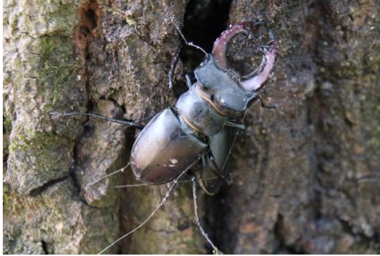
Vliegend hert

Kers op de taart voor de groep die op de terugreis de Tongerense Beek op de Veluwe aandeed, was de waarneming van zes (!) Vliegende herten. Een gedenkwaardige afsluiting van een week waarin we als natuurvereniging weer hebben kunnen ervaren wat de meerwaarde is van het samen optrekken, het elkaar wijzen op bijzonderheden, het uitwisselen van kennis en leren van elkaar, en je opgenomen voelen in een groep die je misschien nog niet goed kende. Kortom: natuur verbindt!