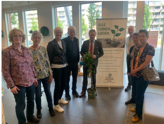
aanbieden van het appelboompje