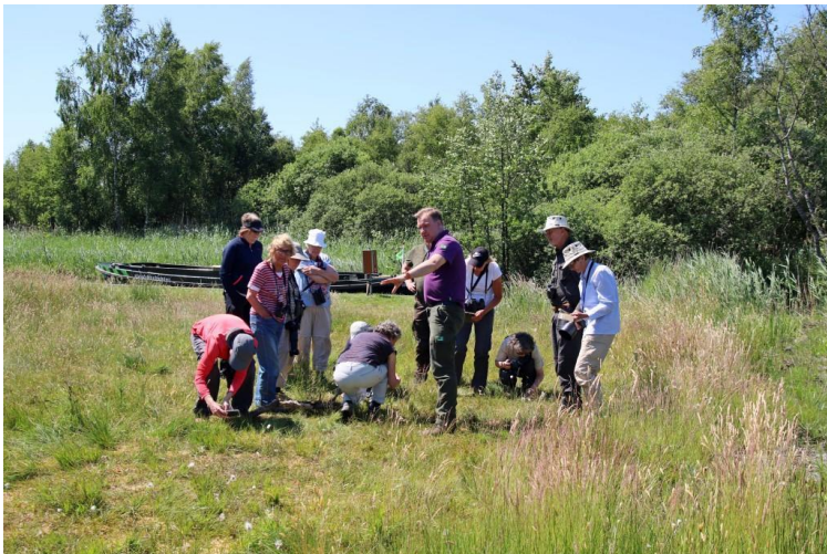
Opperste concentratie

De week startte met een mini-excursie op de dag van aankomst naar de observatievlonder “Lokkenpolder”, als korte kennismaking met het gebied, niet ver van het vakantiepark. Al direct zette een ooievaarsnest met drie jongen de toon: dit wordt een mooie week. Op de vlonder werden we getraakteerd op een vliegshow boven het water van enorme aantallen libellen met namen als Bruine korenbout, Sierlijke Witsnuitlibel, Blauwe breedscheenjuffer en veel andere soorten, een schitterend gezicht. Ook op andere dagen werden “wenssoorten” gezien - de Gevlekte glanslibel was voor velen een topper -, maar ook waren er onverwachte verrassingen, zoals een zwemmende ringslang tijdens de vaartocht, een jagend paar bruine kiekendieven vlak langs het fietspad, een wulp met jongen en een nest Grauwe vliegenvangers vlakbij de afvaart in Ossenzijl. Maar voor de zeldzame grote vuurvliinder waren wij (iets) te vroeg. Deze vlinder legt haar eitjes op de waterzuring, maar alléén op de waterzuring in de Weerribben! Het is nog niet verklaard door welke omstandigheid dat komt.