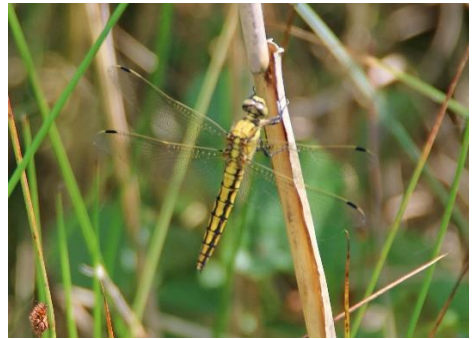
Gewone oeverlibel