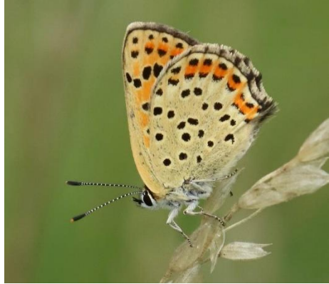
Bruine vuurvinder

Er waren ook veel vogels te bewonderen zoals boom- en veldleeuweriken, gras- en boompiepers, roodborsttapuiten en roofvogels. Het betreft een enkele Buizerd, Torenvalk, Boomvalk en een Slangenarend zittend in een dennenbosje en af en toe jagend hoog boven de hei. Deze grote soort overzomert de laatste decennia op de Veluwe. Een broedgeval heeft nog niet plaats gevonden want het betreft gewoonlijk meestal net niet volwassen vogels, die op hun jeugdige zwerftochten de rijkdom aan slangen en hagedissen op de Veluwe ontdekken en dan gedurende de zomer blijven hangen.