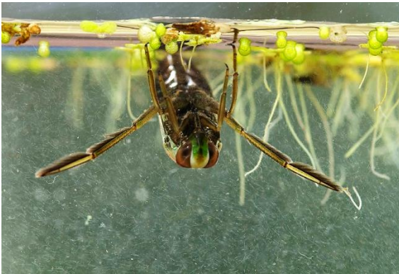
Imago (foto Dirk-Jan Saaltink)

Deze waterwantsen, waarvan in ons land 6 soorten voorkomen, worden vaak rug- of ruggenzwemmers genoemd en dat komt door hun ruggelingse zwemwijze. De onderzijde van bootsmannetjes heeft wel iets weg van een bootje, vandaar de naam. Echte voorvleugels hebben deze insecten niet. Deze zijn namelijk veranderd in dekschilden, die de tere achtervleugels, waarmee ze goed kunnen vliegen om wateren te koloniseren, beschermen. Dat de buikzijde steeds boven blijft, is te danken aan twee luchtreservoirs tussen de buikharen, waardoor bootsmannetjes lichter zijn dan water. Deze reservoirs worden via een adembuisje aan de achterlijfspunt aan het wateroppervlak regelmatig bijgetankt. Bootsmannetjes kunnen met op roeien lijkende stevige zwemslagen van de achterpoten de stijfkracht van de luchtreservoirs overwinnen. Met klauwtjes kunnen zij zich aan onderwater-objecten vasthouden.