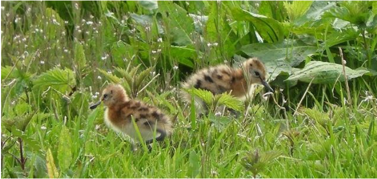
jonge grutto's

Toen grutto Leziria op 10 juni vertrok uit de polder Bloemendaal liet zij haar jongen achter. Ik liet Menno Kuiper weten dat ik mij verbaasde dat die jongen in staat waren op eigen gelegenheid naar het overwinteringsgebied te vliegen. Mijn verbazing werd door Menno gedeeld. Ook hij wist het antwoord niet maar opperde wel een aantal mogelijkheden. Misschien is het aangeboren of leren ze het van hun soortgenoten. Wellicht sluiten ze zich aan bij volwassen grutto's of andere trekvogels die nog niet vertrokken zijn.