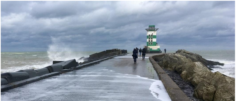
De pier van IJmuiden

Deze excursie op 21 oktober was eigenlijk een week eerder gepland. Het is toen niet door gegaan omdat de pier afgesloten was vanwege de harde wind. Op de website van de KNNV staat bij fotoalbums het fotoverslag van deze excursie. Met 8 mensen trokken wij er die zaterdag op uit. Wij begonnen met een kop koffie bij een strandtent, zodat wij nog een deel van het laatste restje regen van die ochtend misliepen. Daarna door het duin naar de pier. Het waaide waardoor de vogeltjes in het duin moeilijk waren waar te nemen. Op het strand bij de pier troffen wij een groep drieteenstrandlopertjes aan die hyperactief heen en weer voor de golven uit renden. De steenlopers lieten zich al snel zien. Ook bij de pier zijn er burenrudies, in dit geval een juveniele mantelmeeuw die een aalscholver aanviel. Waarschijnlijk probeerde de mantelmeeuw de prooi van de aalscholver afhandig te maken. De eerste bijzondere waarneming bestaat uit een kuifaalscholver, die in Nederland voornamelijk bij pieren wordt waargenomen. De volgende waarneming heeft niets met vogels te maken. Wat een prachtig uitzicht vanaf de pier. De donkere lichten met het zilveren strand. De zwarte zee-eend liet zich niet van