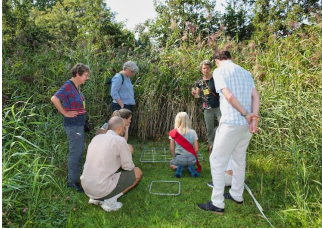
Buitenactiviteit tijdens het weekend van de Goudse biodiversiteit

We blijven in overleg met de gemeente. Men neemt ons serieus en de samenwerking is prettig. De landelijke KNNV organiseert in mei 2024 de “Week van de Biodiversiteit”. I.v.m. Pinksteren starten wij een week later met een ambitieus Gouds programma waaronder drie avondexcursies (in twee groengebieden en een in de binnenstad), een biodiversiteitlesing en een nacht vlindercafé op het Heempad en speciaal voor kinderen en hun ouders een natuurspeurtocht op het Heempad.