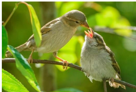
Huisumus met juveniel

Alhoewel de Huismus in ons land nog altijd een van de meest algemene broedvogels is gaat het niet goed met de Huismus. Sinds 1990 is het aantal meer dan gehalveerd. Reden voor Vogelbescherming en Sovon de soort in de schijnwerper te zetten en 2014 tot jaar van de Huismus te verklaren.