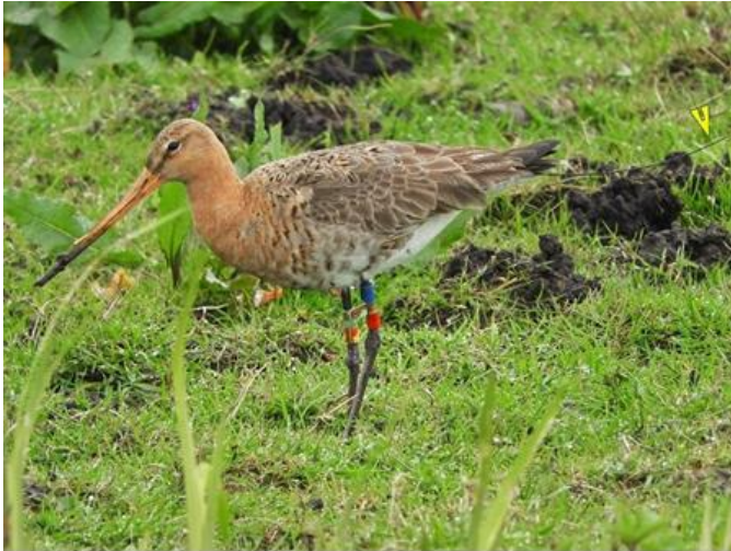
Grutto Leziria

In de vroege ochtend van 19 maart van dit jaar bleek het dier weer te zijn teruggekeerd van haar overwinteringsgebied.