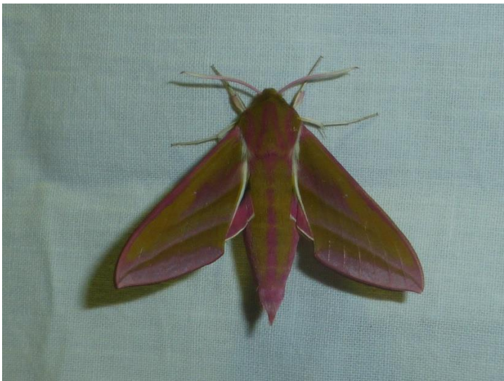
Groot avondrood

In mei viel de derde vrijdag van de maand (17-05) ook in het water dus ook toen konden de lampen niet aan. Gelukkig kregen we in mei nog een herkansing omdat we in het kader van de week van de biodiversiteit op 31-05 een nachtvlindercafé hadden georganiseerd. Dit keer was het wel goed weer en waren zo'n 20 belangstellenden getuige van maar liefst 55 soorten nachtvlinders (23 micro's en 32 macro's). Hiervan waren 5 soorten nieuw voor het Heempad, waarvan het Groot Avondrood de meest aansprekende was.