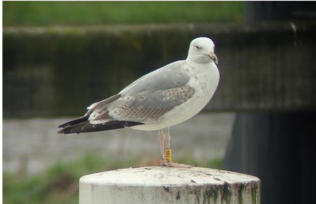
Pontische meeuw (P:2GU)

Wit JH511 is een mannetje stormmeeuw die eind augustus 2018 is geringd in de buurt van Stavanger, Noorwegen. Hij is daar met de hand gevangen als niet-vliegvlug jong. De eerste waarneming was in februari 2019 in Gouda bij de Veerstal tijdens een wintervogeltelling. In juli en augustus 2021, april 2022, mei, juli en september 2023 is JH511 telkens gezien in de buurt van Bergen, Noorwegen zo'n 190 kilometer ten noorden van zijn geboorteplek. In november en december 2023 zag hem ik weer op de Veerstal in Gouda. JH511 lijkt dus de zomer vaak door te brengen bij Bergen, Noorwegen en sommige winters in Gouda.